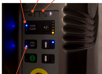
Taille de balle réglable

Sélecteur de matériaux : carton ou plastique Indicateur de balle complète Indicateur d'entretien