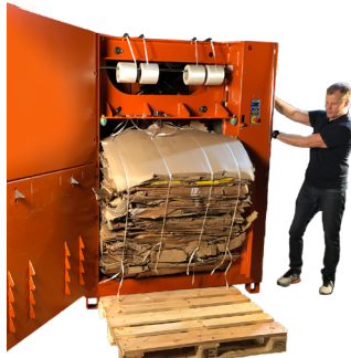
Appuyez simplement sur deux boutons pour éjecter la balle

Cette presse est rapide avec son cycle de 16 secondes seulement. Grâce à la fonction de série de démarrage automatique, elle est rapidement opérationnelle pour le chargement de carton ou plastique. La 3220 peut s'activer manuellement mais il est préférable de la faire fonctionner en mode automatique pour une meilleure productivité et une meilleure commodité.