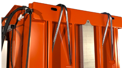
Tuyaux pour un liage facile de la balle